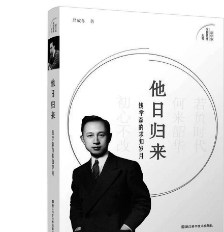
《他日归来：钱学森的求知岁月》，吕成冬著，浙江科学技术出版社2019年8月出版

再次，成为大家要接受系统的现代教育，要与时俱进地接受现代知识。出生在民国肇始之际的钱学森，童年及少年时代在教育资源集中的北京接受完整的中小学教育；以高分考入当时有“东方麻省理工”之称的交通大学机械工