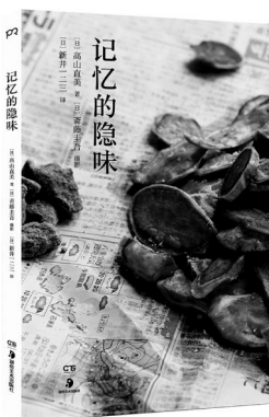
《记忆的隐味》，[日]高山直美著，[日]藤井圭吾摄影，[日]新一二三译，湖南美术出版社2019年7月出版

这部小说穿梭于现实与梦幻之间，抓拍到了各种让人一夜成长、到老年都不敢承认的难忘时刻。