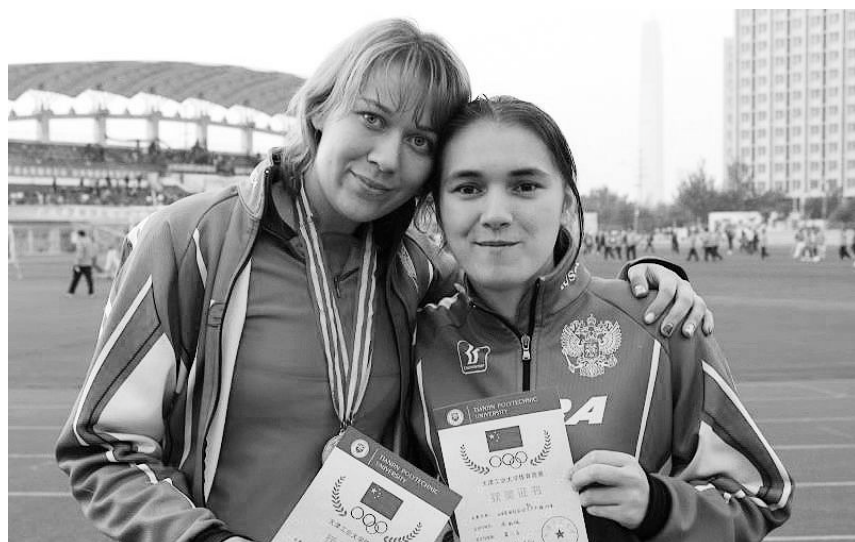
天工大俄罗斯姐妹花在学校运动会上取得好成绩。

姐妹俩在学业上也收获颇丰，连续两年专业排名第一、第二。在学科专业比赛中也取得不错的成绩，姐妹俩作为主要成员参加的团队在首届留学生“一带一路”商业模拟大赛中获得二等奖。