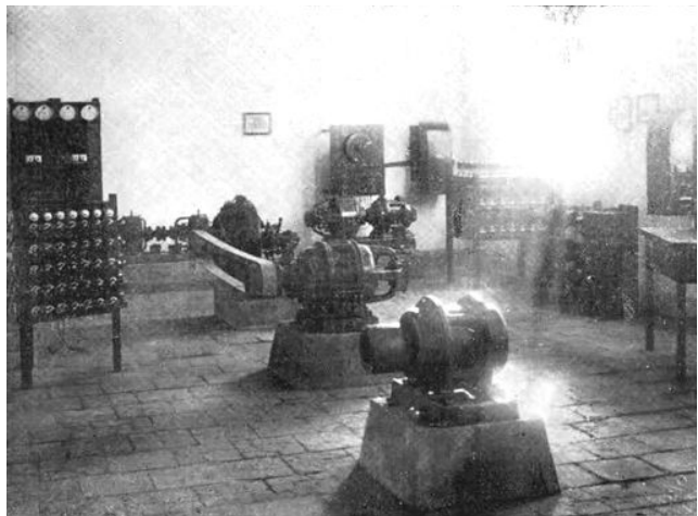
20 世纪 30 年代前后，河北省立工业学院电机实验室一角。