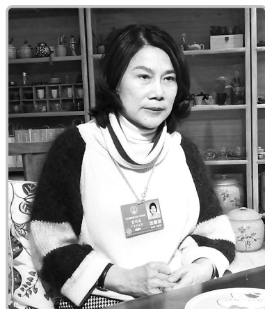
珠海格力电器股份有限公司董事长

格力的“黑灯工厂”其实就是无人工厂。目前格力在全国有八个基地基本实现了无人工厂,用机器替代了人工作业,这是实体经济的转型升级。在推出无人工厂的背后,格力寻找到了一个方向,就是产品要结合消费者的需求,同时需要更多先进设备作为支撑。中国要成为制造业强国,必须拥有核心技术。希望中国能在短时间内真正实现从中国制造向中国创造转变。