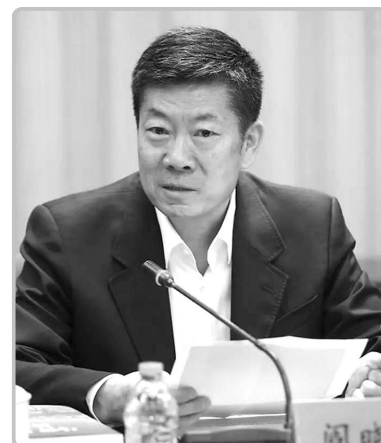
中国版权协会理事长

文化“走出去”,在海外也要高举保护知识产权的大旗。随着数字网络技术的不断发展,网络侵权新情况不断出现,一些未经备案的小网站,特别是一些服务器设在境外的网站,让大批优质的中国版权作品在海外遭受各种盗版侵权,而且维权困难。在打击跨国网络侵权盗版活动中需要国与国之间的协同、协调和协作,通过技术手段、市场手段、法律手段整合利用,发挥整体效应。同时,打击跨国网络侵权盗版,还需要加强国际合作。要高度重视海外中国作品的知识产权保护,为中国文化“走出去”扫清障碍。