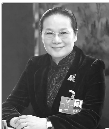
九三学社中央副主席

知识产权已日益成为创新竞争、贸易保护的有力工具。近年来,我国着力加强顶层设计,知识产权保护制度日趋完善。例如,为了进一步加强知识产权保护,根据实践需要,按照提高侵权违法成本、扩大权利保护范围的方向,我国进一步修改完善了相关法律法规。第四次专利法修改将主要解决目前我国专利保护中的突出问题,切实维护专利权人的合法权益,增强创新主体对专利保护的信心,一视同仁地保护中外企业及权利人合法权益,充分激发全社会的创新活力,营造良好营商环境。