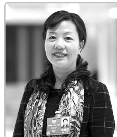
四川省知识产权局局长

科技成果转化是国家科研投入和发明人创造性劳动的最大浪费,避免浪费的有效途径就是实行职务科技成果的混合所有制。近两年来,除少数高校的科技成果转化转移有一定起色外,全国大部分高校院所的科技成果转化转移并没有明显的改善,现行科技成果转化转移制度还没有彻底解决科技成果转化转移的深层次问题。应允许高校与职务发明人通过采取约定方式确认职务发明知识产权归属,发明人享有不低于70%的知识产权比例,适用于既有知识产权分割确权专利共同申请。(本报记者李晨整理)