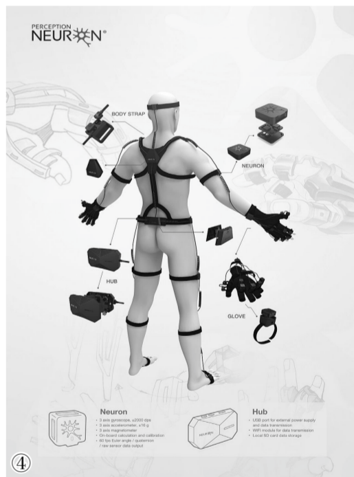
①人工智能等高精尖产业的发展,正在不断壮大中关村发展新动能。 ②硅谷科技孵化加速器 Plug&Play 中国总部入驻中关村智造大街,中关村国际创新生态链条再添有力一环。 ③外籍人才在中关村外国人服务大厅办理在华永久居留证相关手续。 ④诺亦腾 MEMS 惯性传感器的动作捕捉技术