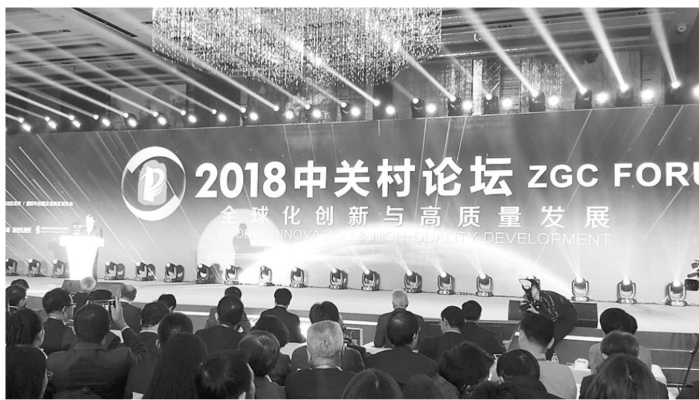
2018 中关村论坛召开,展示“世界的中关村”。

代表的国家高新区认真贯彻落实党中央决策部署,紧紧围绕发展高科技、实现产业化这一宗旨,充分发挥了创新引领示范作用,成为科技创新和产业发展的重要策源地。