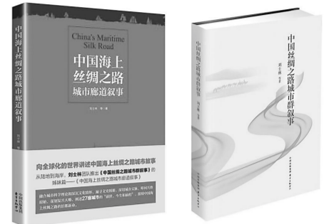
《中国海上丝绸之路城市廊道叙事》，刘士林等著，东方出版社2017年5月出版

近日，在上海交通大学举行的2017中国“一带一路”城市发展战略论坛上，《中国海上丝绸之路城市廊道叙事》发布，该书用60万字、200余幅文献图片向全球化的世界讲述了中国海上丝绸之路城市故事。