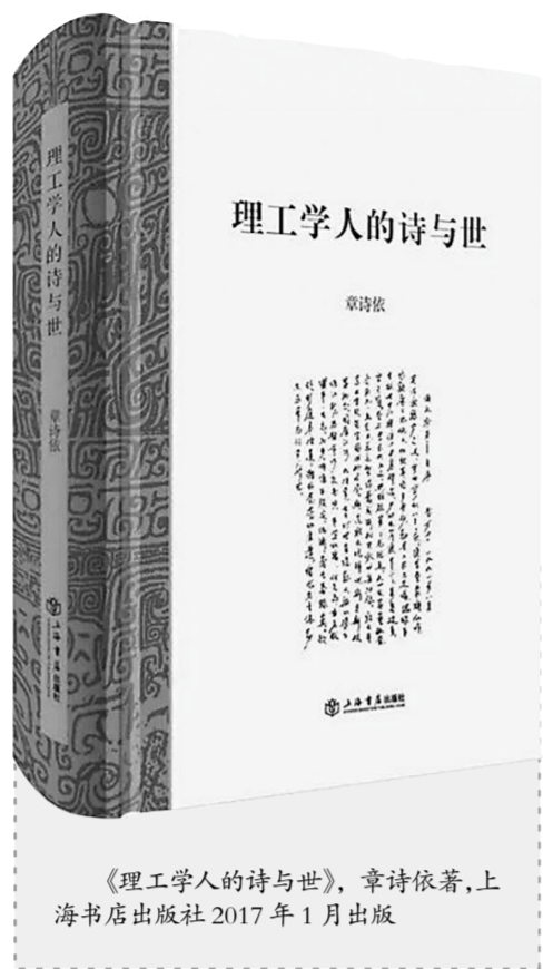
《理工学人的诗与世》，章诗依著，上海书店出版社2017年1月出版

2017年是中国古脊椎动物学的开拓者和奠基人杨钟健诞辰120周年。在纪念活动中，中国科学院古脊椎动物与古人类研究所所长周忠和说，杨钟健首先是一位杰出的爱国者，“大丈夫只能向前”——杨钟健的这句诗，是他一生最好的写照。