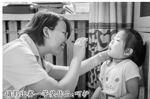
摄影比赛一等奖作品:呵护