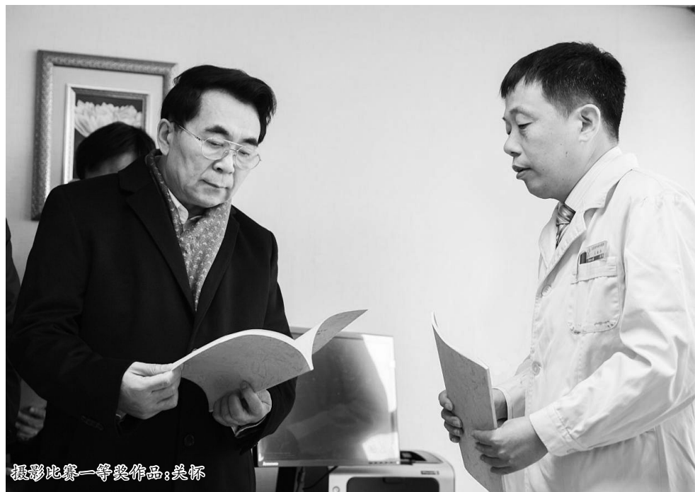
摄影比赛一等奖作品:关怀