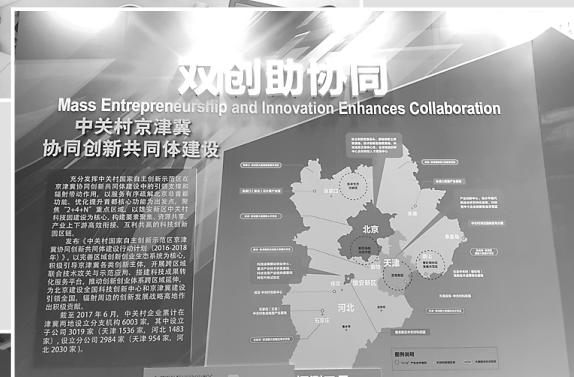
▲中关村影响力辐射京津冀。