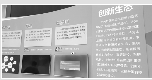
▲中关村形成了完整的创新创业生态系统。