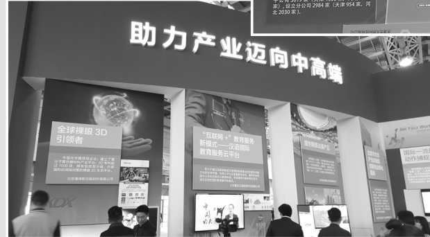
▲中关村创新积极助力产业向中高端迈进。

励,科研经费管理、高新技术企业认定、全国性场外交易市场等重大试点,10余项试点政策已推广至全国或其他国家自主创新示范区。推动出台了“京校十条”“京科九条”等市级政策,示范区研究出台了支持重大前沿原创技术成果转化和产业化、提升创新能力优化创新环境、支持人才发展优化创业服务、促进科技金融深度融合创新发展、促进一区多园协同发展的“1+4”资金政策支持体系。