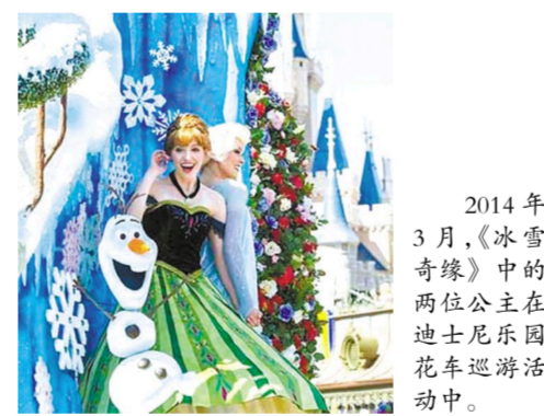
2014年3月,《冰雪奇缘》中的两位公主在迪士尼乐园花车巡游活动中。

迪士尼公司2013年推出的3D动画片《冰雪奇缘》在全球赢得了票房与口碑的双丰收,包揽了2013年度金球奖、安妮奖和奥斯卡最佳动画长片奖,其主题曲《随它吧》也斩获奥斯卡最佳原创歌曲奖,在全世界风靡一时。对于这样一部广受欢迎的电影佳作,迪士尼公司显然不愿放弃掘金的机会。如今,在其位于美国佛罗里达州奥兰多市的艾波卡特主题公园内,以《冰雪奇缘》为主题的新娱乐设施正在打造之中。