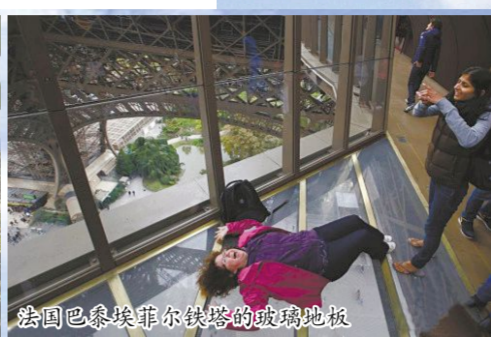
法国巴黎埃菲尔铁塔的玻璃地板

300米，垂直高度达到180米。玻璃天桥所在地地势险峻，两峰崖壁陡直，中间裂谷横穿。游客走在玻璃天桥上，摇摇晃晃，有如腾云驾雾一般。