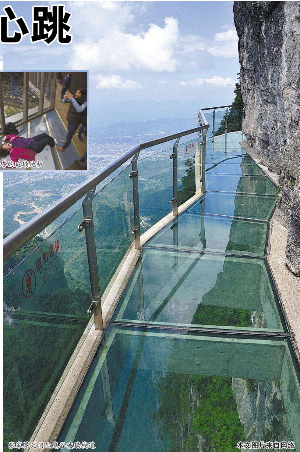
张家界天门山鬼谷玻璃栈道

今年，有些历史悠久的旅游景观也开始修建玻璃观景设施，焕发新的生命力。11月，英国伦敦的地标式建筑伦敦塔桥的玻璃地板修建完成，透过玻璃地面，游客可以360度俯瞰泰晤士河和两岸美景。在此之前，法国巴黎埃菲尔铁塔的玻璃地板已在公众面前亮相。此玻璃地板位于铁塔中空结构的正下方基座，在这里，游客可俯视距离脚底57米的地面。