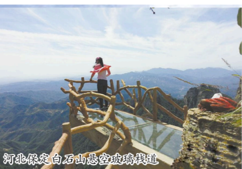
河北保定白石山悬空玻璃栈道