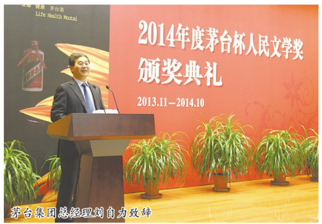
茅台集团总经理刘自力致辞