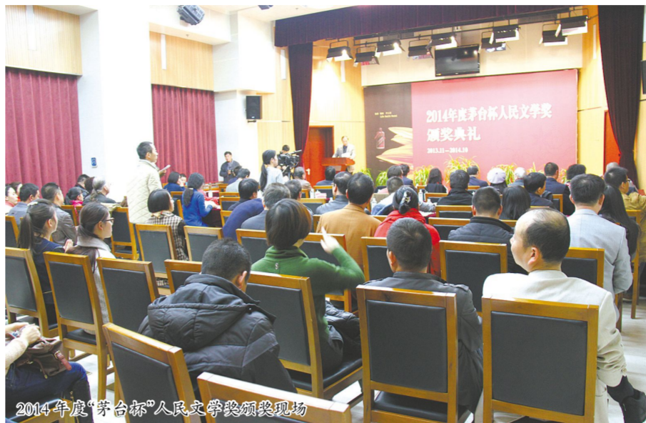
2014年度“茅台杯”人民文学奖颁奖典礼现场