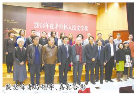
获奖作者与领导、嘉宾合影