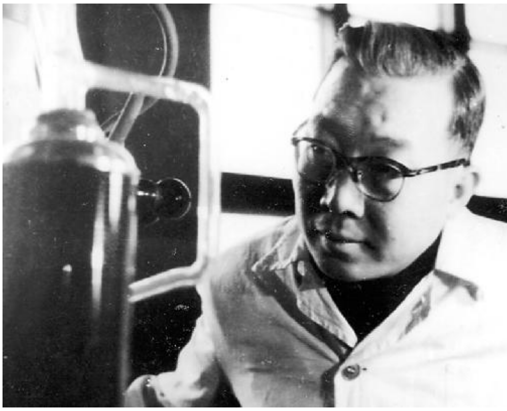
上世纪60年代初期,李薰在实验室工作。

我比李薰先生小5岁,也算是同龄人。我自1955年9月从美国回国后,被分配到金属研究