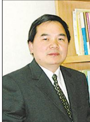
中国科学院院士包信和

包信和：激发人才创新创业的活力应该包括两方面内容：首先是要激发人的创造力。创造力来自于自由的想象和大胆的探索。为此，无论是企业还是社会都应该营造一个自由探索的空间，尽可能剔除和减少一些机制和体制方面的条条框框，特别是那种重量轻质的评价体制，同时建立并完善合理的激励机制。人有不同的价值观，有人追求科研上的成就，也有些人想通过技术创新获得更大的经济回报。无论是追求学术、经济利益还是追求社会认同，只要是正当的利益诉求，都是无可厚非的。一个合理的激励机制就是要让每个人都能感到有发挥潜力、发展能力的可能性，都能充分实现自我价值。