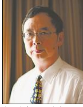
中国科学院院士朱清时