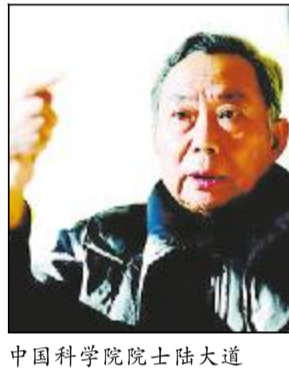
中国科学院院士陆大道