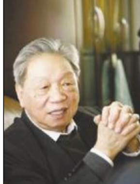
中国科学院院士陈可冀